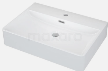
KERAMIK-WASCHBECKEN Moccori eckig 60,5x42x12cm mit Überlauf