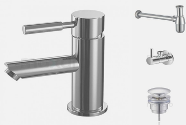
WASCHTISCHARMATUR Varono Waschtischarmatur , Serie Cinqua 55.003.561, Varono Siphon 99.050.024, Varono Eckventile 99.300.004 jeweils 2 Stk. pro Waschbecken, Varono Waschbecken Ablaufventil PopUp 99.000.404