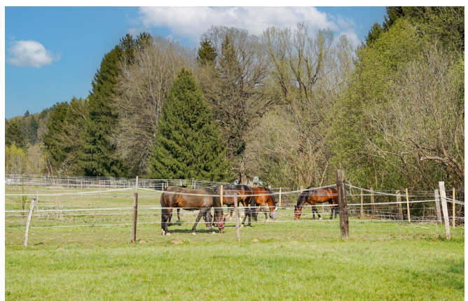
Reiten in Hart bei Graz

Alle weiteren Angebote finden Sie direkt auf der Gemeindegewebseite: www.hartbeigraz.at