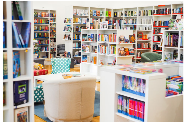
Bibliothek Hart bei Graz