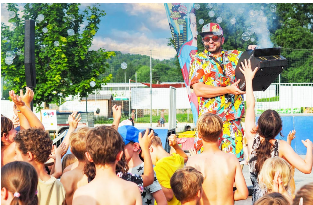
Sommerolympiade am Spielplatz Hart bei Graz

Zahlreiche kinder- und familienfreundliche Veranstaltungen – von der Faschingsdisco on Ice bis zur beliebten Sommerolympiade machen Hart bei Graz zu einem lebendigen Ort für alle Generationen.