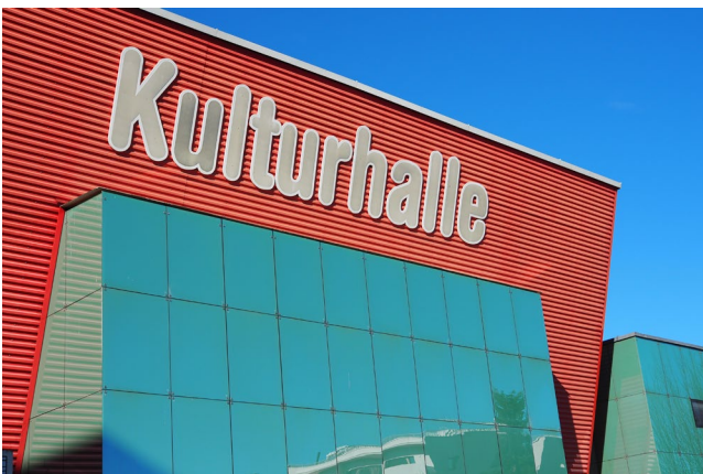
Kulturhalle Hart bei Graz

Golf: in 550 m zu Fuß beim Golfclub Klockerhof