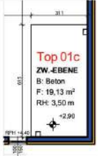
Grundriss OG M 1:200