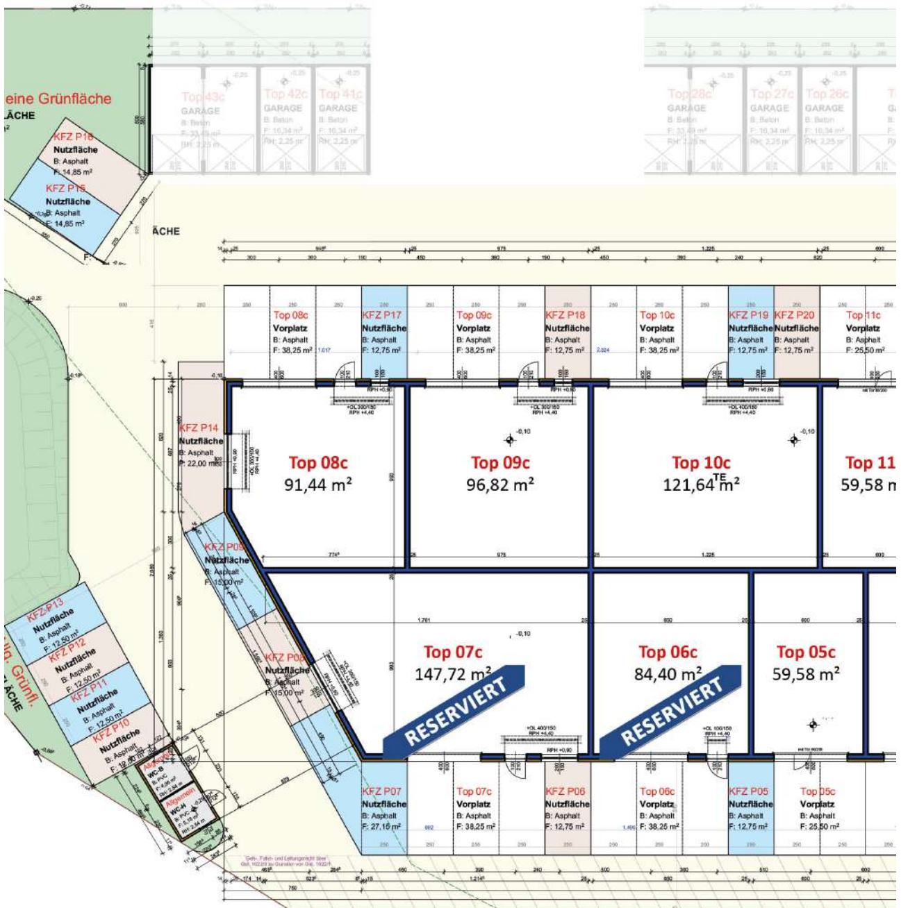
Grundriss EG M 1:200