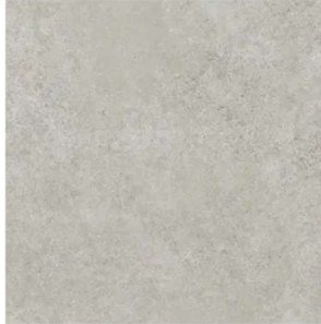
Marazzi Room Grigio 60x60 cm Bodenfliese / Wandfliese Matt Eben Naturale

Aufpreis: brutto 1.000,00€ Nur für Bad, WC, TR und VR EG