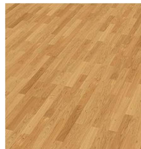
Scheucher BILAflor 28.1200 Eiche classic (natur) matt lackiert