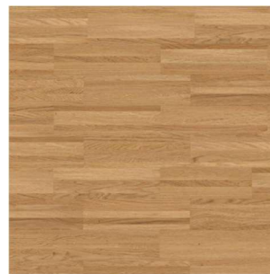
Weitzer Diele 360 Eiche ruhig