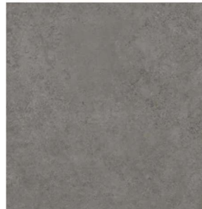
Marazzi Room Antracite 60x60 cm Bodenfliese / Wandfliese Matt Eben Naturale

Aufpreis: brutto 1.000,00€ Nur für Bad, WC, TR und VR EG