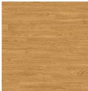
Weitzer Stab 2245 | Eiche | ruhig | gebürstet