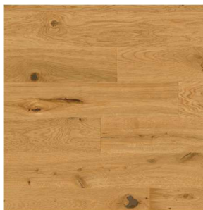
Weitzer Diele 1800 | Eiche | wild | gefast, gebürstet