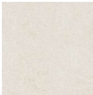
Fliesen Marazzi Konzept Bianco natur 60x60