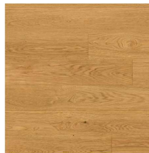
Weitzer Diele 1800 | Eiche | ruhig | gefast, gebürstet