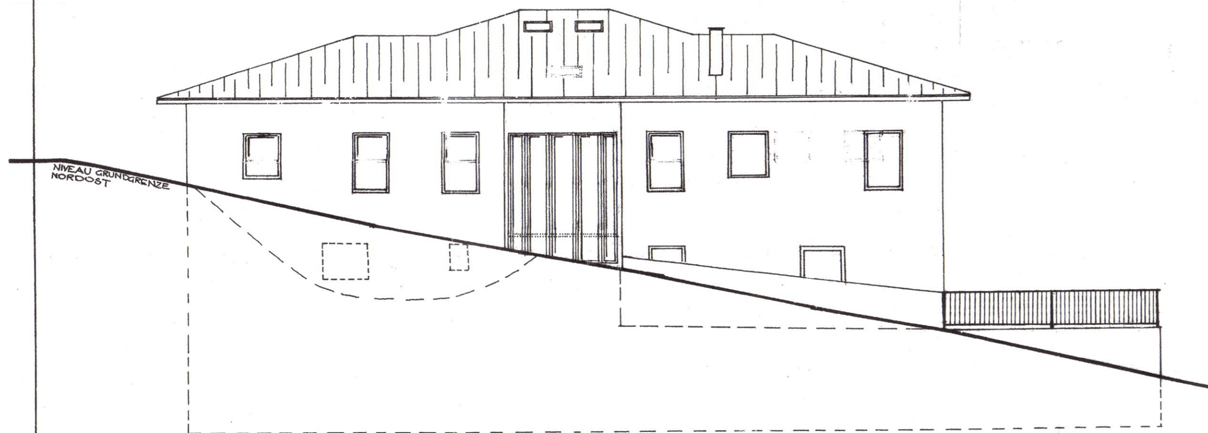
NORDOST - ANSICHT