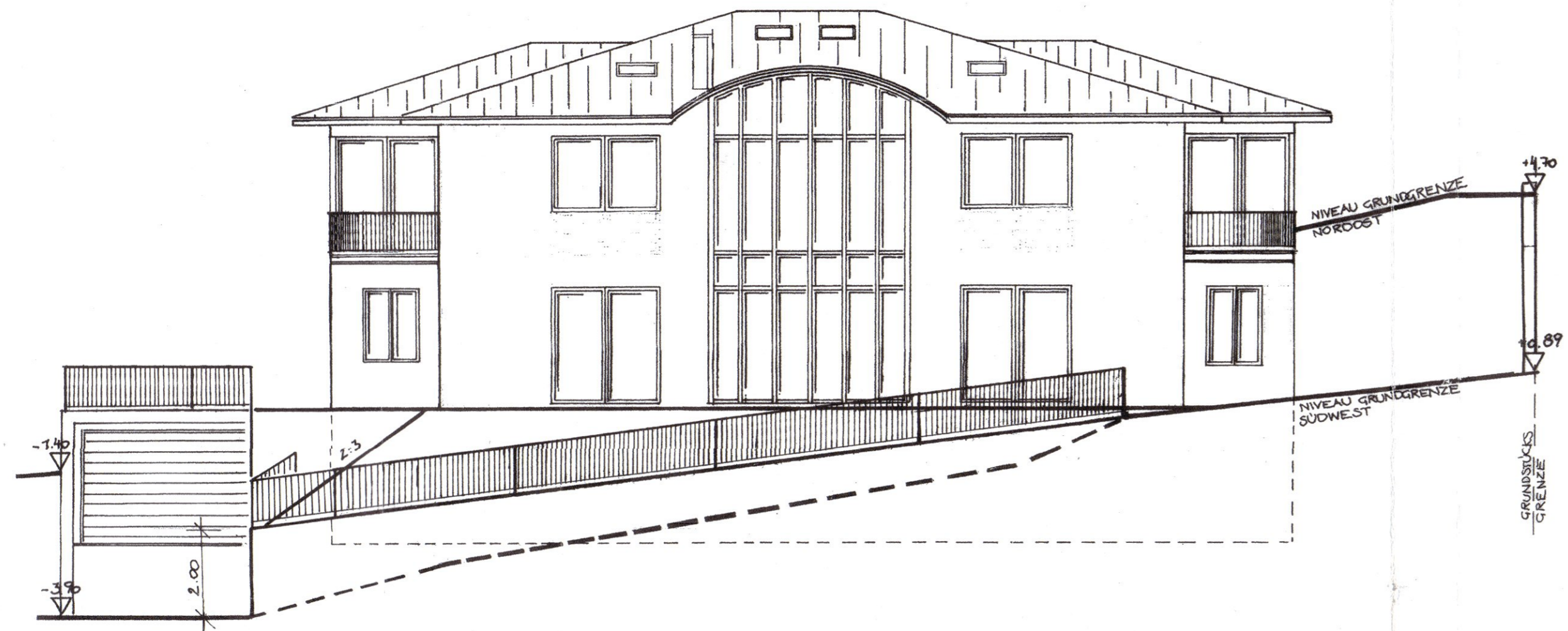
SÜDWEST - ANSICHT