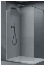
DUSCHGLASTRENNWAND WALK-IN 120X200X1CM

inkl. Stabilisationsstange & Wandbefestigungsprofil Verstellmöglichkeit 15mm