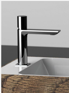
WASCHTISCHARMATURE Mariani Serie 5th Avenue