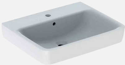
KERAMIK-WASCHBECKEN Moccori eckig 59,5x48x18,5cm mit Überlauf