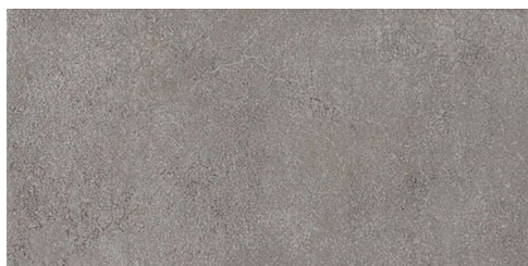
Gänge / Stiegen: R9, Format 30 x 60 cm,