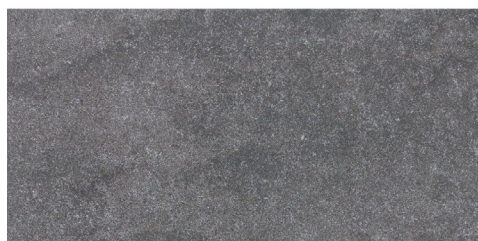
Bodenfliese R10, Format 30 x 60 cm