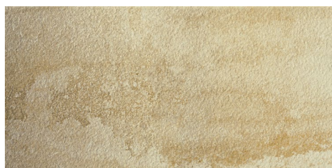
Bodenfliese R10, Format 30 x 60 cm