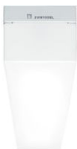
Deckenfeuchtraumleuchte LED in Garage und Keller

Busch & Jaeger – Balance oder gleichwertiges